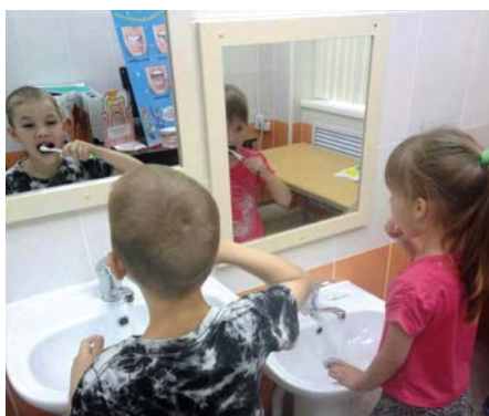
Урок гигиены в кабинете «Гигиена и профилактика заболеваний полости рта» в ГБУЗ ПК «ГСП №3» г. Перми

Кроме того мероприятия проходили в кабинетах гигиены полости рта стоматологических поликлиник. Врачи провели консультации и профилактические осмотры, приуроченные к празднованию Всероссийского Дня Стоматологического Здоровья.