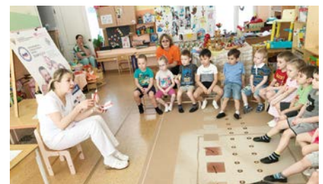
Урок здоровья в МАДОУ «Детский сад №370» г. Перми

В рамках проведения мероприятия на 37 площадках города Перми и Пермского края были организованы уроки гигиены в дошкольных и школьных образовательных учреждениях, на которых детские стоматологи рассказали о трех простых шагах к здоровой улыбке, в игровой и познавательной форме с использованием дидактических материалов продемонстрировали методики правильного ухода за полостью рта.