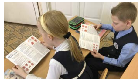
Урок гигиены в МАОУ «СОШ №102» г.Перми