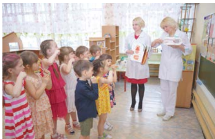
Урок здоровья в МБОУ «Начальная школа-детский сад» г. Лысьва

Затем стоматологи совместно с детьми контролировали полученные знания и навыки. Ребята на фантомах осваивали методику стандартной чистки зубов.