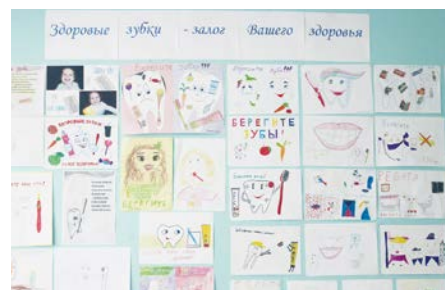
Конкурс рисунков и плакатов «Здоровые зубы – залог Вашего здоровья»

В школах и дошкольных учреждениях г. Чайковский был проведен конкурс рисунков и плакатов «Здоровые зубы – залог Вашего здоровья». Ребята проявили большой интерес к конкурсу и приняли в нем активное участие под впечатлением от проведенных уроков гигиены. Всего на конкурсе было представлено 64 замечательных рисунка. Жюри было непросто выбрать лучшие работы, так как все они были интересны и достойны победы. За участие в конкурсе все дети были награждены грамотами и подарками.