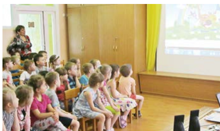
Урок гигиены в МАОУ «ЦРР ДДС №16 «Березка» г. Добрянка

В детском саду №16 «Березка» г. Добрянка урок здоровья завершился просмотром мультипликационных фильмов «Доктор стоматолог» и «Улыбка».