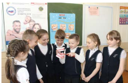
Урок гигиены в МАОУ «СОШ №109» г. Перми

В детском саду №16 «Березка» г. Добрянка урок здоровья завершился просмотром мультипликационных фильмов «Доктор стоматолог» и «Улыбка».