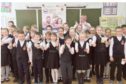
Урок гигиены в МАОУ «Лицей №3» г. Перми

С 20 марта по 20 апреля более чем в 50 субъектах Российской Федерации прошло празднование «Всероссийского Дня Стоматологического Здоровья», с центральным днем празднования 20 марта. «Всероссийский День Стоматологического Здоровья» заявлен в федеральном Всероссийском Календарном плане Стоматологической Ассоциации России-2018 (основание: Постановление Совета СтАР №22 от 18 апреля 2017).