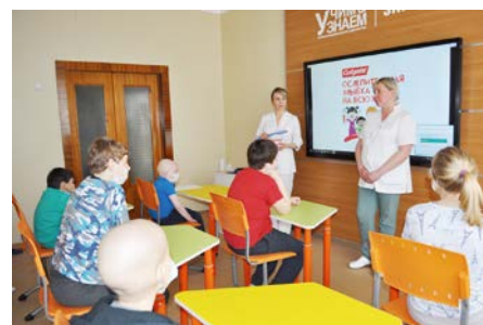
Урок здоровья в Онкологическом центре г. Перми

В детском онкогематологическом центре краевой детской клинической больницы г. Перми так же прошел урок здоровья. Детские стоматологи рассказали ребятам об особенностях строения молочных и постоянных зубов, о правилах ухода за зубами. Дети на моделях были обучены правилам чистки зубов. С помощью интерактивной доски продемонстрированы мультфильмы. И, конечно, все детишки получили подарки от спонсоров благотворительной акции.