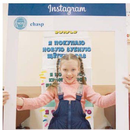
Фото-акция в Instagram «Улыбнись своему здоровью», ГБУЗ ПК «Чайковская стоматологическая поликлиника»

В детском онкогематологическом центре краевой детской клинической больницы г. Перми так же прошел урок здоровья. Детские стоматологи рассказали ребятам об особенностях строения молочных и постоянных зубов, о правилах ухода за зубами. Дети на моделях были обучены правилам чистки зубов. С помощью интерактивной доски продемонстрированы мультфильмы. И, конечно, все детишки получили подарки от спонсоров благотворительной акции.