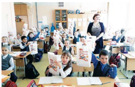
Урок гигиены в МАОУ «СОШ №47» г. Перми

По окончании урока детям были вручены полезные подарки по уходу за полостью рта и информационные буклеты.