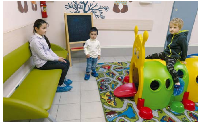
Крисанова, 10. Детское стоматологическое отделение

История Городской стоматологической поликлиники №3 – это, по большому счету, веки становления стоматологической службы Перми. 50 лет назад в учреждении начали прием жителей Дзержинского района краевого центра. За