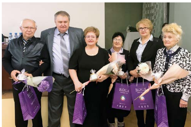
Награждение почетных членов ПРАС