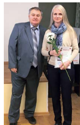
Вручение наград СТАР

В рамках конференции состоялась торжественная церемония награждения почетных членов ассоциации в честь 25-летия со дня её основания.