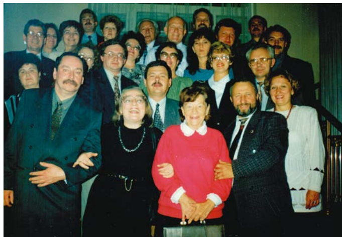
Пермская делегация стоматологов на всероссийском съезде в г. Москва

Многое уже сделано, но еще есть очень много задач, которые предстоит решить в ближайшие